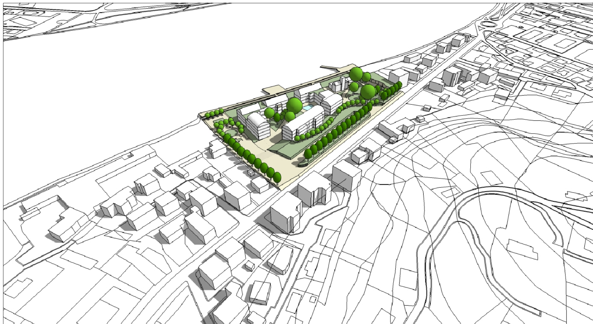
INSERIMENTO URBANO VISTA DA SUD - EST