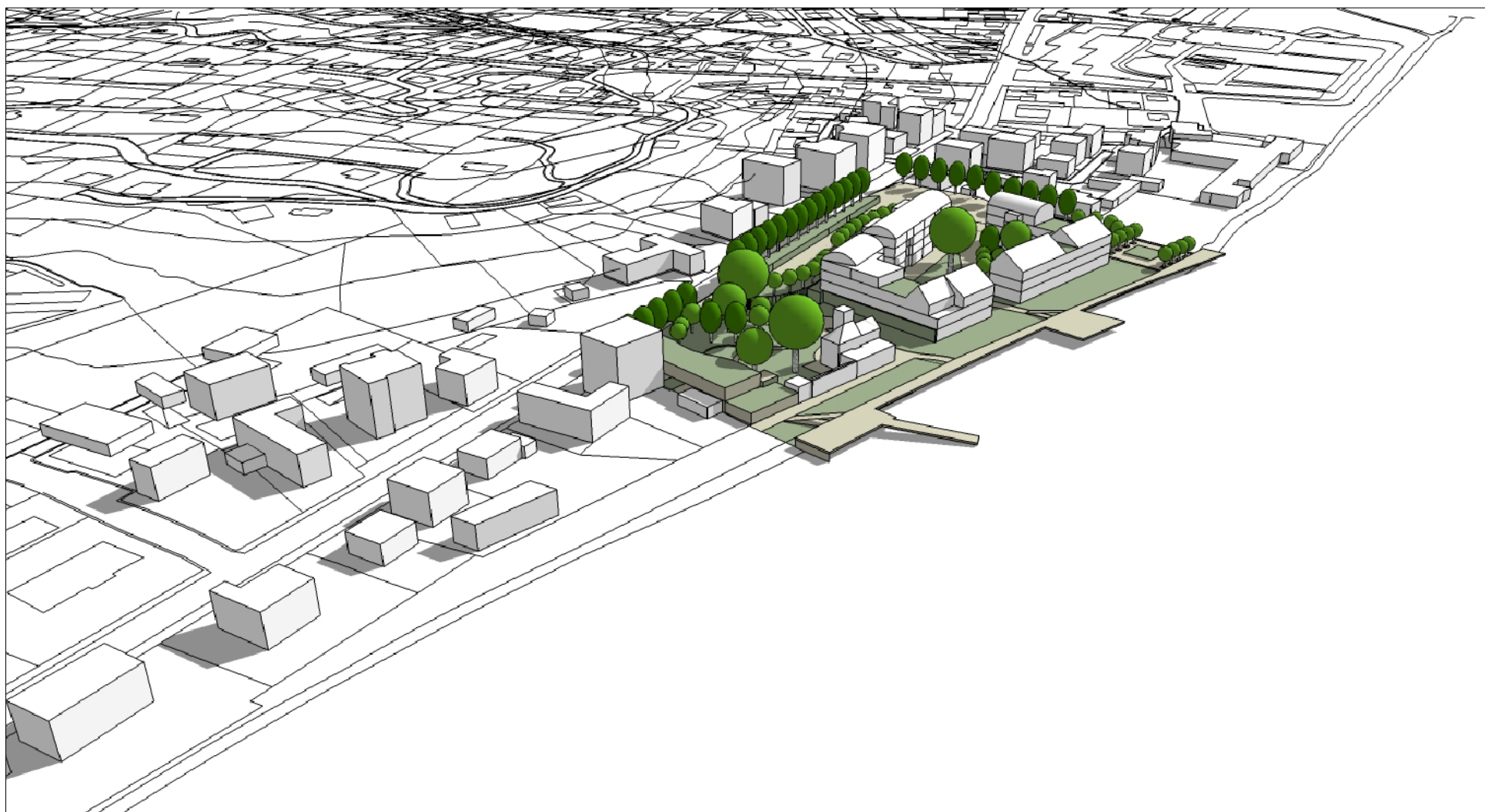
INSERIMENTO URBANO VISTA DA NORD - OVEST