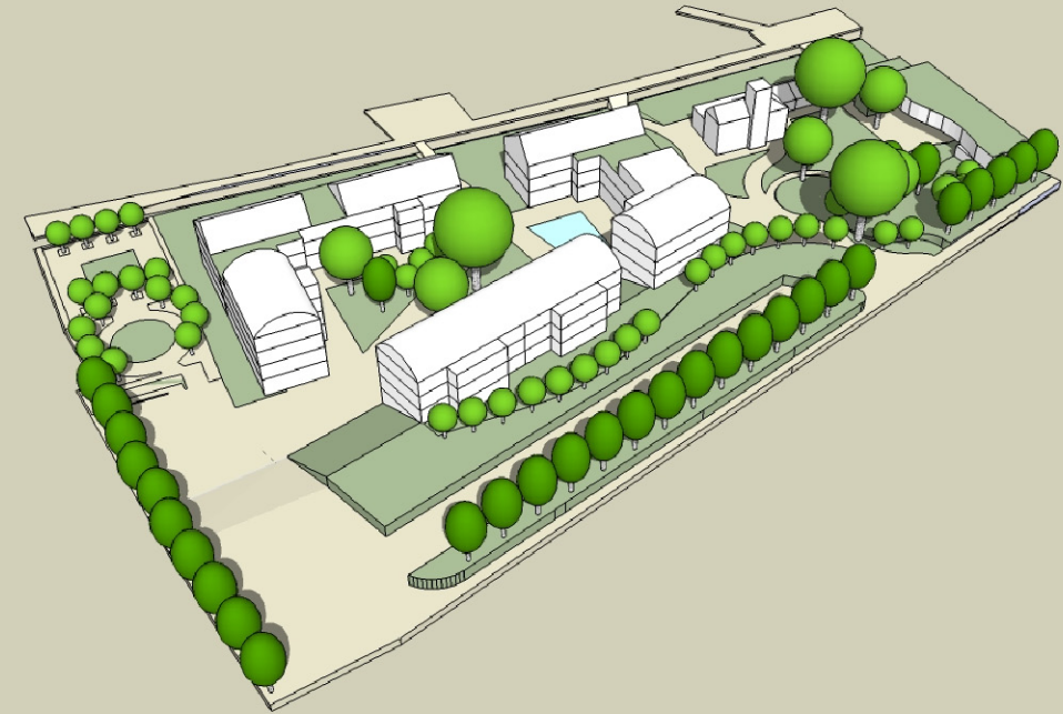
Ore 12.00 - 21 marzo