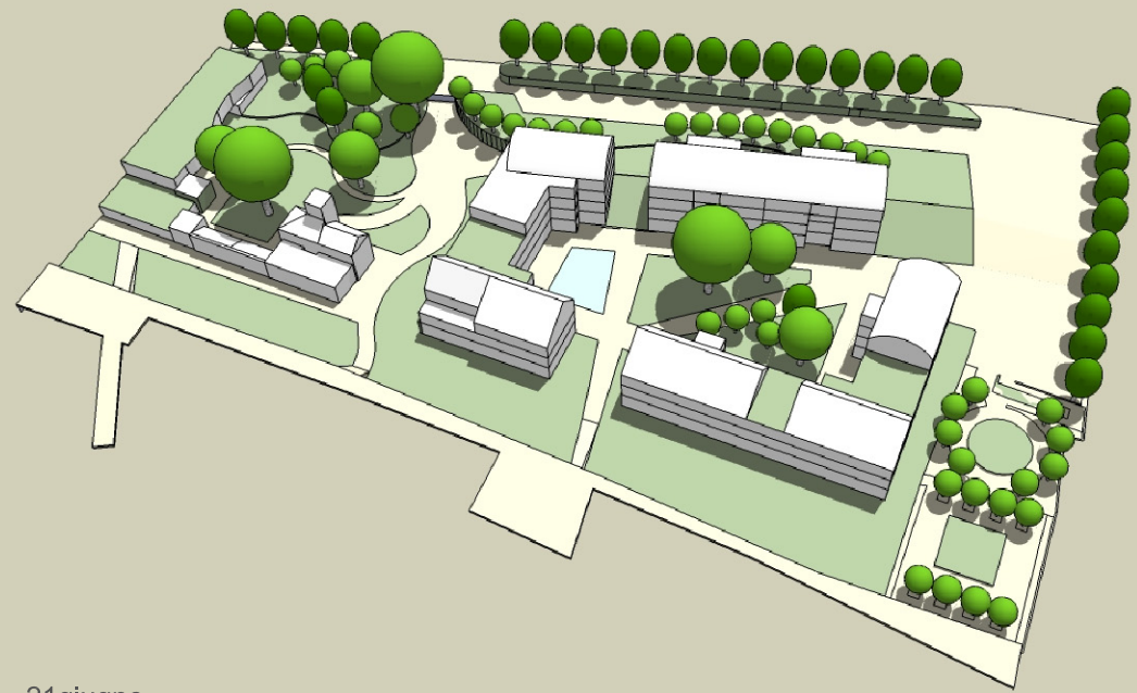
Ore 12.00 - 21 giugno