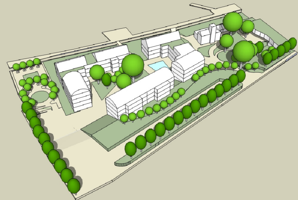
Ore 12.00 - 21 settembre