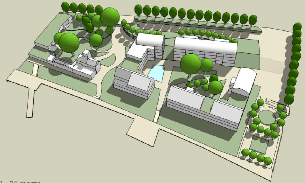
Ore 12.00 - 21 marzo