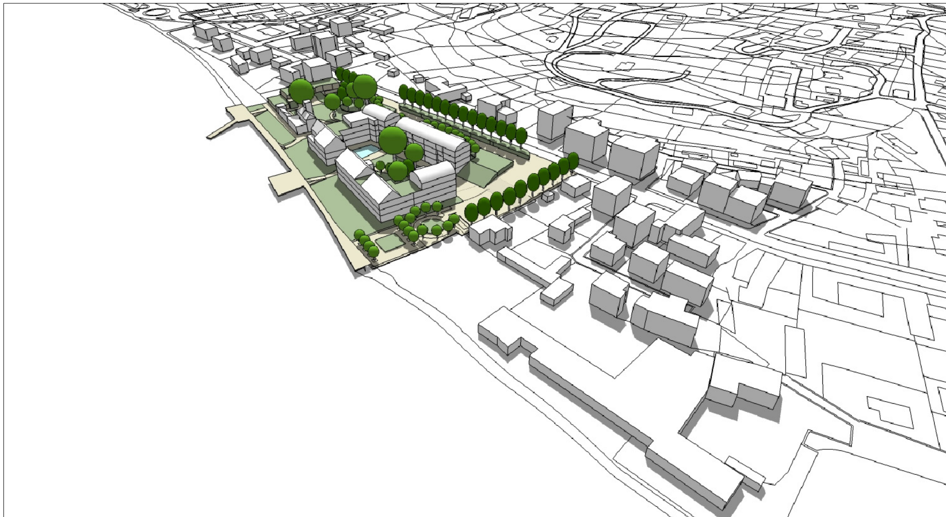
INSERIMENTO URBANO VISTA DA NORD - EST