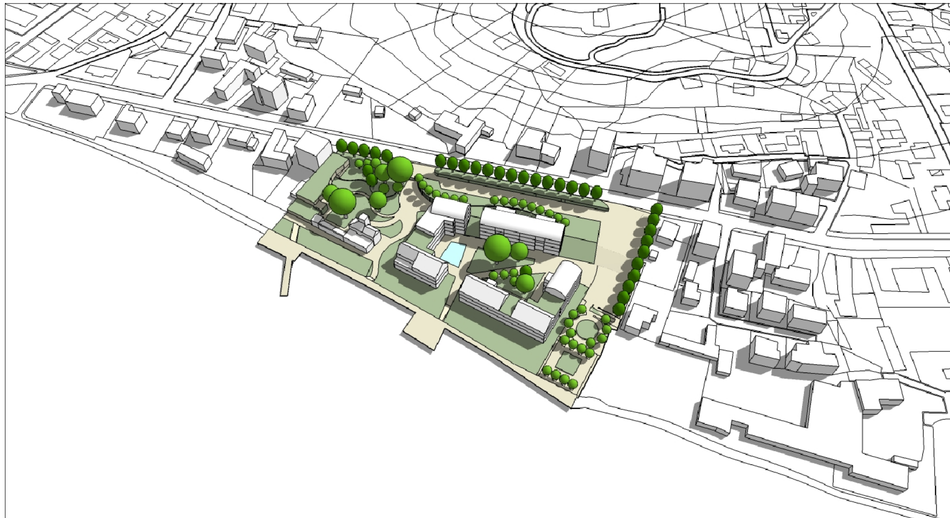
INSERIMENTO URBANO VISTA DA NORD - EST