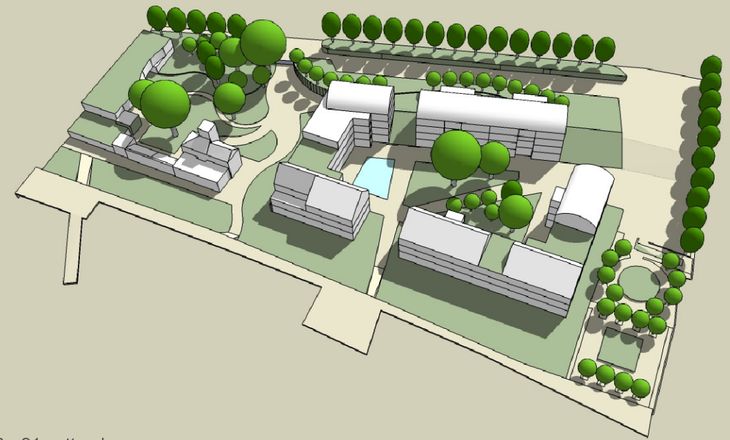
Ore 12.00 - 21 settembre