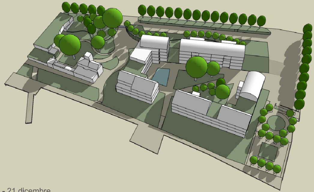
Ore 12.00 - 21 dicembre